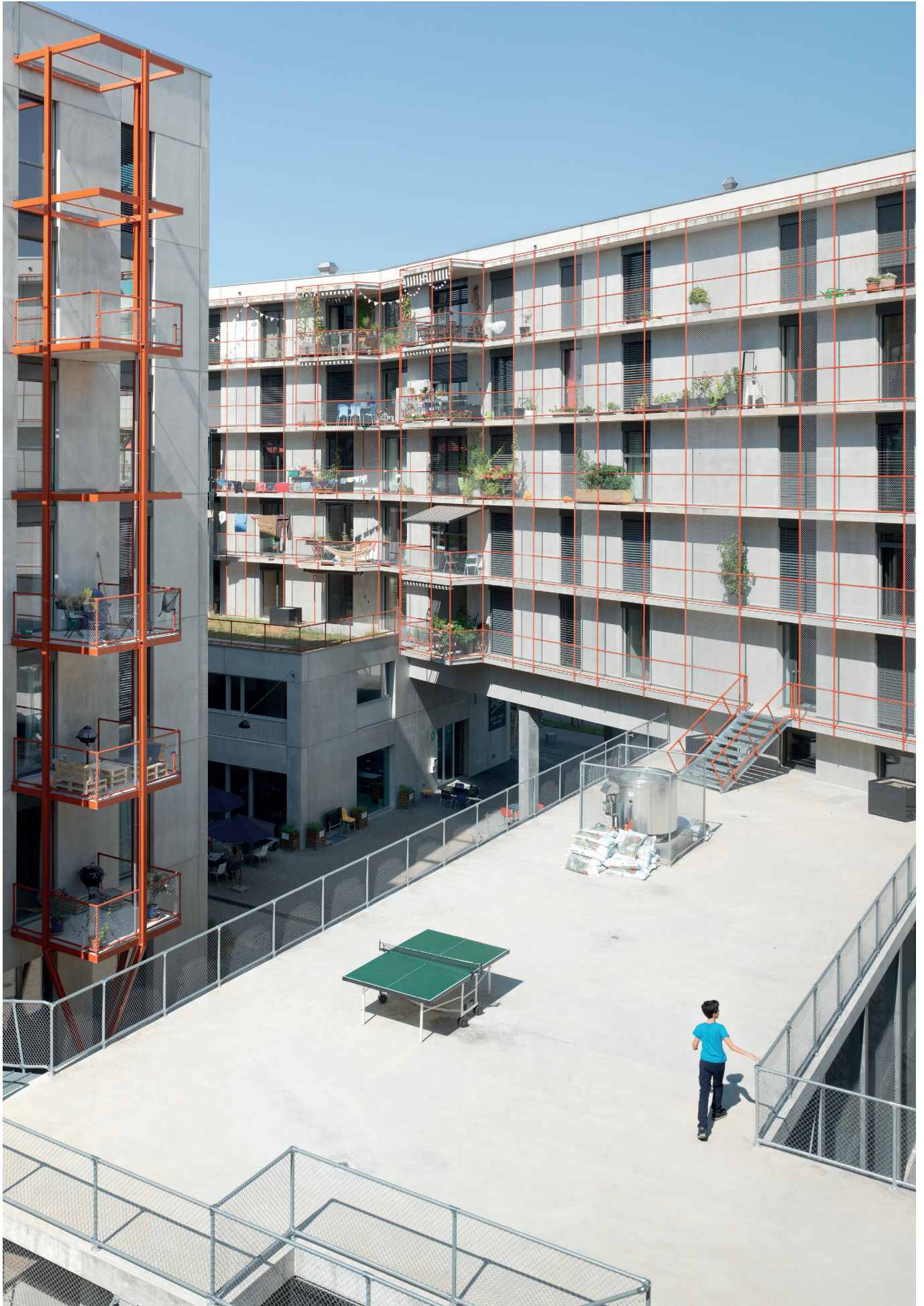
Umsicht – Regards – Sguardi 2017 / Auszeichnung / Distinction / Riconoscimento / Award: Kraftwerk1 Zwicky Süd, Dübendorf (ZH) Auftraggeber / Mandant / Committente / Client: Bau- und Wohngenossenschaft Kraftwerk1, Zürich Team: Bau- und Wohngenossenschaft Kraftwerk1, Zürich; Schneider Studer Primas Architekten GmbH, Zürich; Senn Resources AG, St. Gallen